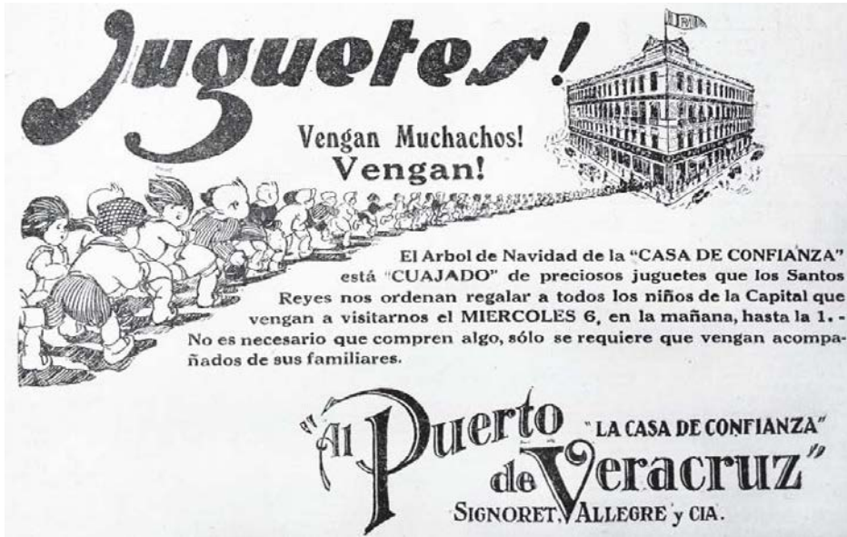
1. Three Kings' Day ad for department store Puerto de Veracruz, 1926.

El Universal Gráfico , January 2, 1926.