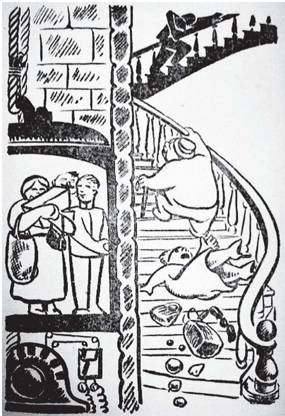
4. The elevator overpowers the staircase. List Arzubide, Troka el Poderoso , p. 69.