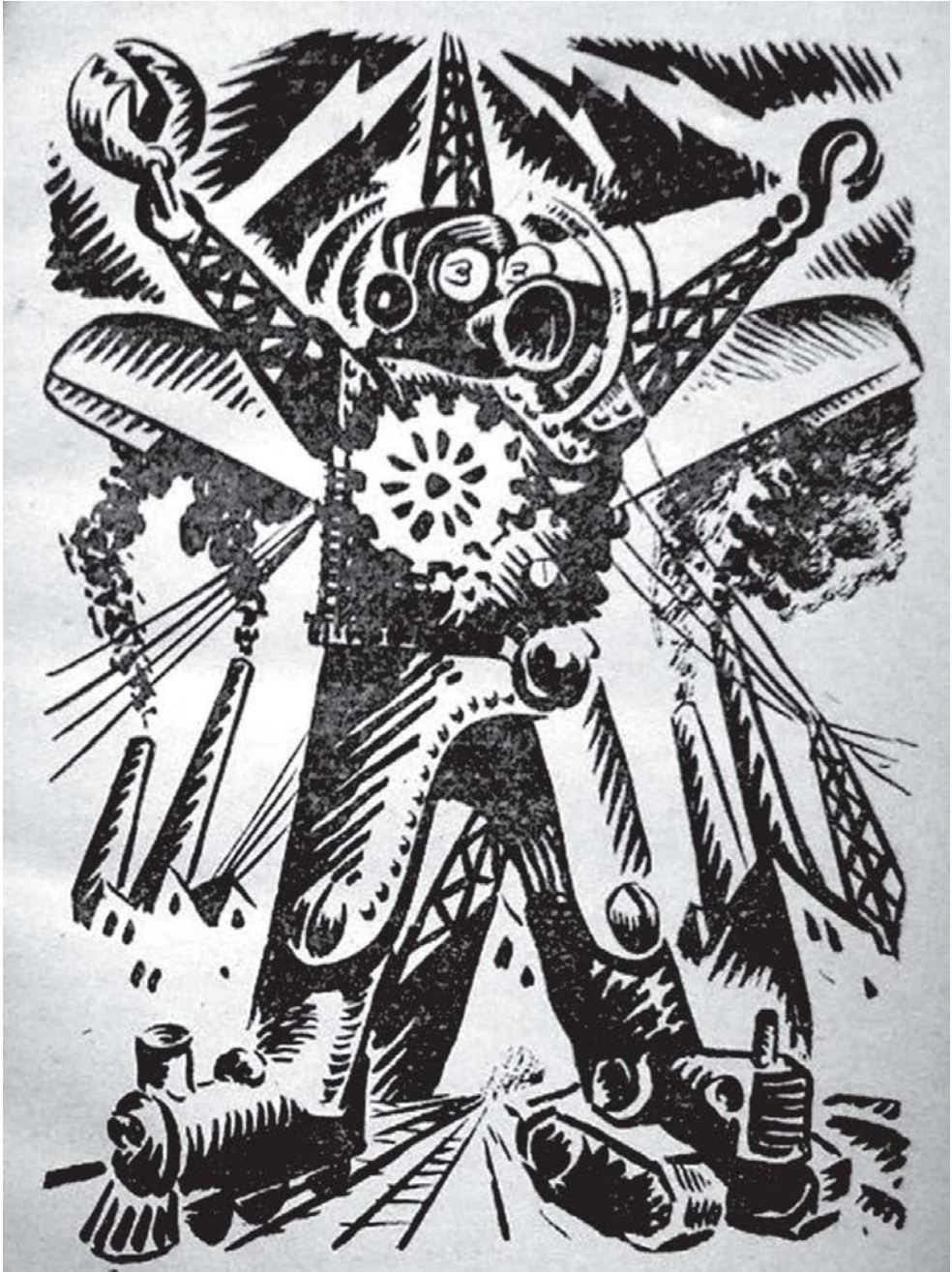
3. Troka el Poderoso embodied multiple forms of technology. List Arzubide, Troka el Poderoso , pp. 14–15.