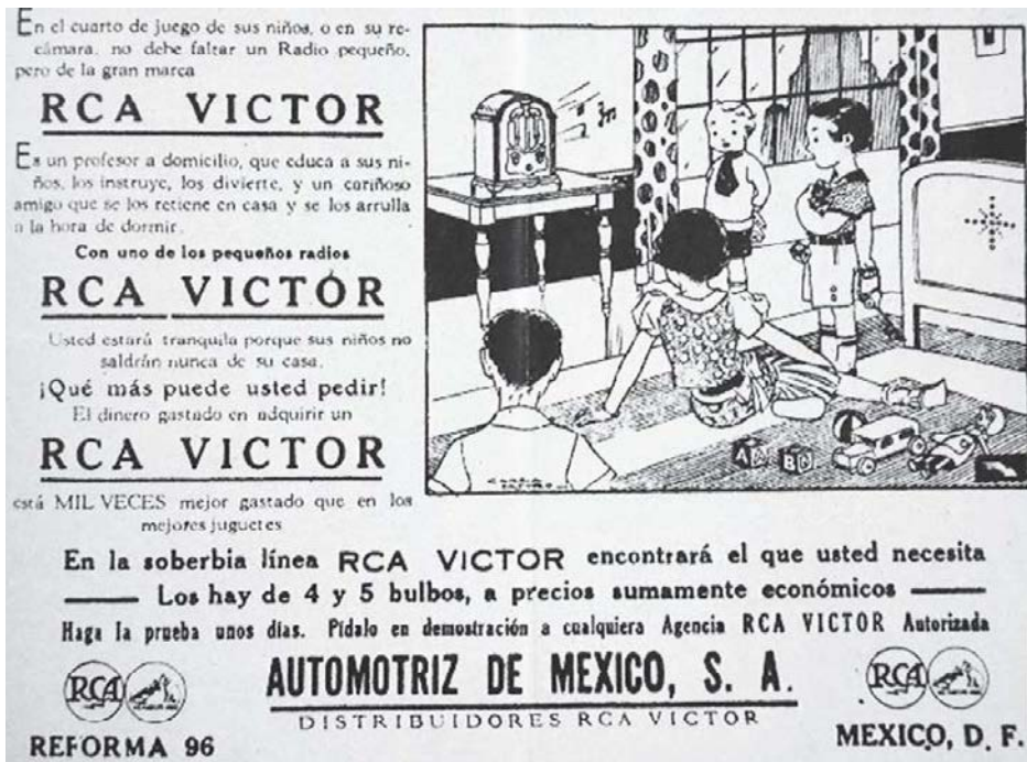
2. RCA ad featuring middle-class children, 1934. Aladino , January 1934, n.p.

El Universal Gráfico , January 2, 1926.