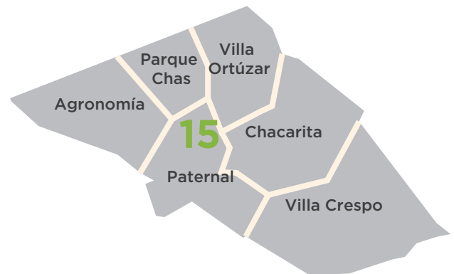
Cuadro 1: Límites Catastrales de los Barrios de Comuna 15