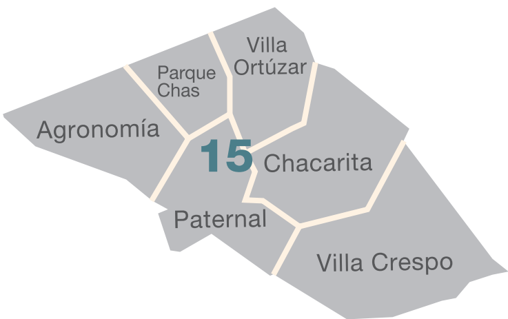
Cuadro 1: Límites Catastrales de los Barrios de Comuna 15